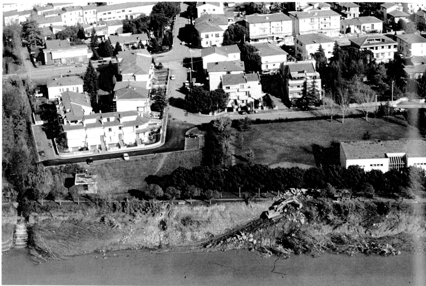
Costruzioni sulle sponde dell'Arno - Zona residenziale in fregio al fiume nel Valdarno inferiore, a valle della Gonfolina (sopra) e lo sviluppo recente di Pontassieve (FI) verso l'Arno (sotto).