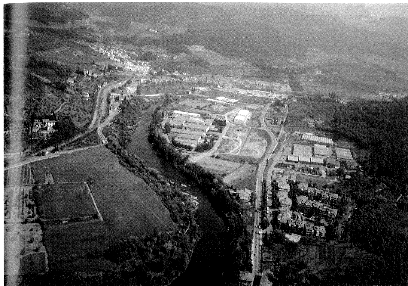
Costruzioni sulle sponde dell'Arno - Panoramica del fiume a monte di Firenze in loc. "Vallina", in Comune di Bagno a Ripoli (sopra) e presso Compiobbi, in Comune di Fiesole (sotto).