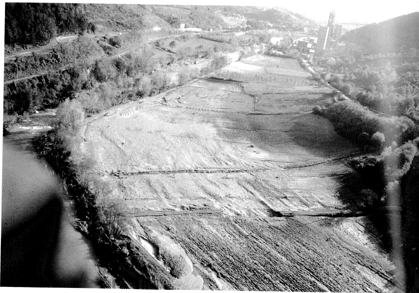
Costruzioni sulle sponde dell'Arno - Aree di pertinenza fluviale nel Casentino (AR), edificate (sotto) e ancora libere da costruzioni (sopra), parzialmente interessate dalla piena dell'ottobre 1992.