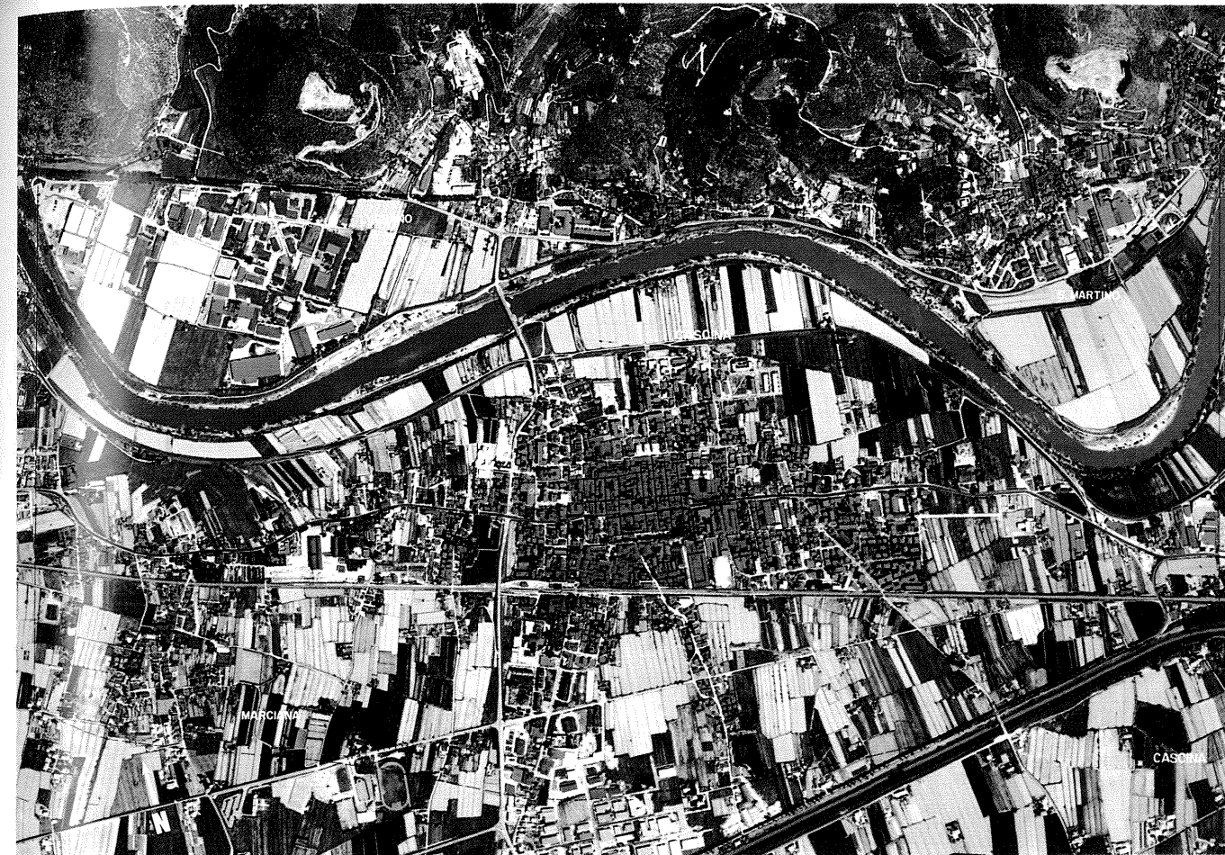
Lo sviluppo dell'urbanizzazione lungo il corso dell'Arno (1954-1973-1993): Cascina e Marciana in sinistra d'Arno e Lignano e S. Martino, in Comune di Vicopisano, in destra (nella foto sopra); Uliveto T., Caprona, S. Lorenzo alle Corti, Campo e Loiano (sotto) - In colore rosso è evidenziato l'edificato presente nel 1954; in colore azzurro il suo incremento rilevato nel 1973; le trasformazioni successive al 1973 e presenti nel 1993 risultano sulle fotografie aree non colorate. Con gli stessi colori sono evidenziate le principali infrastrutture.