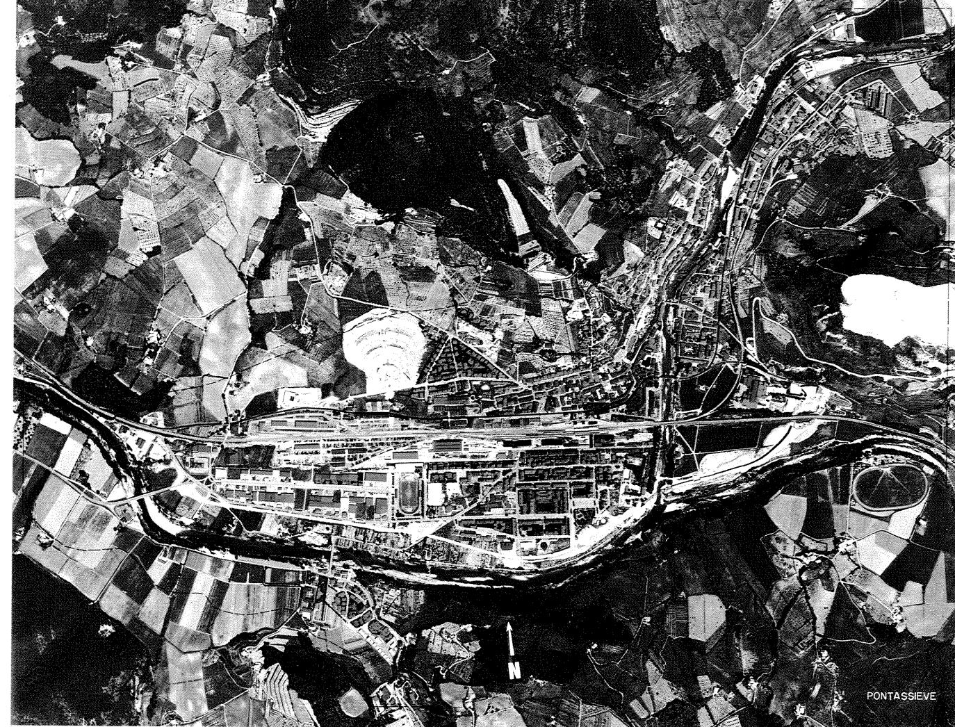
Lo sviluppo dell'urbanizzazione lungo il corso dell'Arno (1954-1973-1993): Pontassieve (FI) (sopra) e Ugnano, a ovest di Firenze (sotto) - In colore rosso è evidenziato l'edificato presente nel 1954; in colore azzurro il suo incremento rilevato nel 1973; le trasformazioni successive al 1973 e presenti nel 1993 risultano sulle fotografie aree non colorate. Con gli stessi colori sono evidenziate le principali infrastrutture.