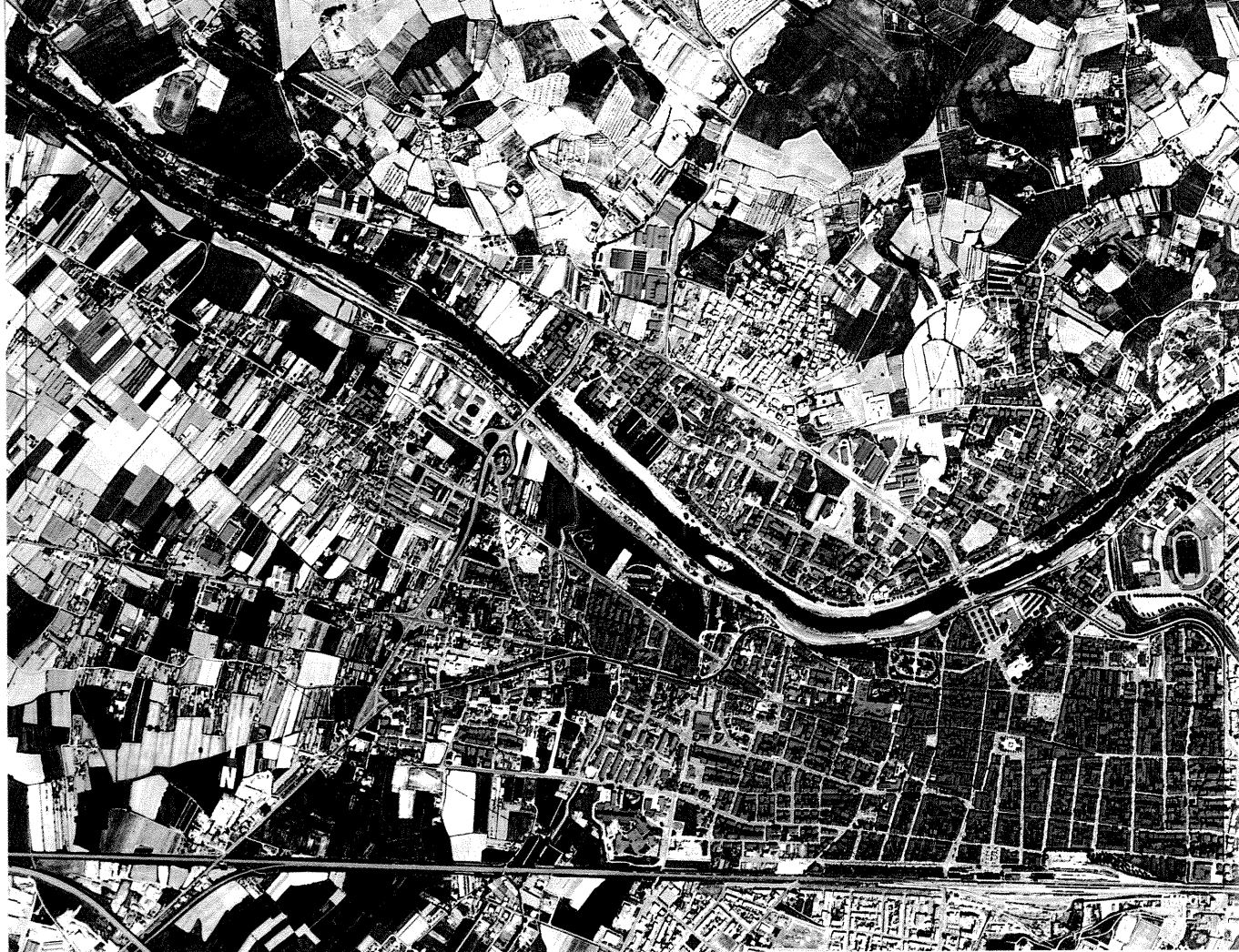
Lo sviluppo dell'urbanizzazione lungo il corso dell'Arno (1954-1973-1993): Empoli (FI) (sopra), Castelfranco di Sotto e S. Romano (PI) (sotto) - In rosso è evidenziato l'edificato presente nel 1954; in azzurro il suo incremento rilevato nel 1973; le trasformazioni successive al 1973 non sono colorate. Le principali trasformazioni del territorio, già in buona parte realizzate nel 1973, sono il risultato indotto dalla legge urbanistica 765/1967, nota come "legge ponte", che consentiva per il periodo di un anno l'edificazione anche in assenza di autorizzazione edilizia nei comuni privi di strumenti urbanistici efficaci.